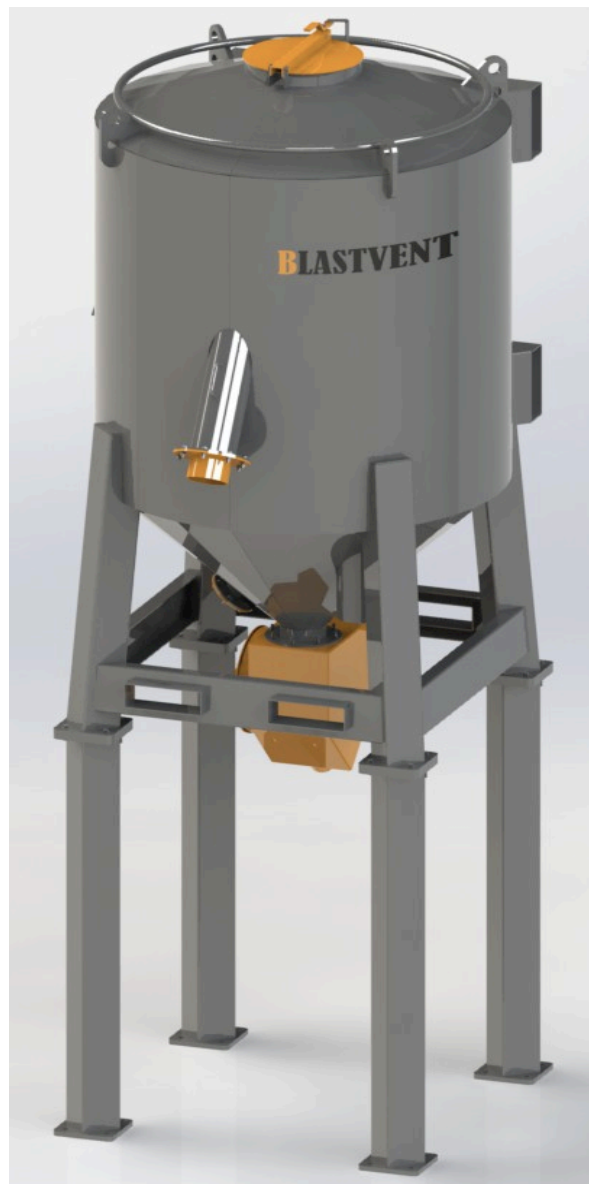
* Вакуумный бункер-накопитель VSH-2500-2